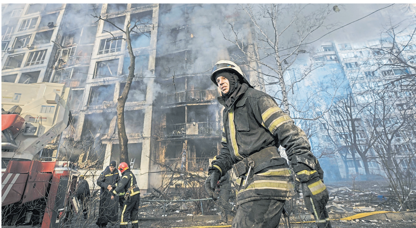
Edificios civiles fueron atacados ayer en zonas residenciales de Kiev por misiles rusos

Rusia intensificó la ofensiva en varias ciudades; Zelensky dijo que no ingresará en la OTAN