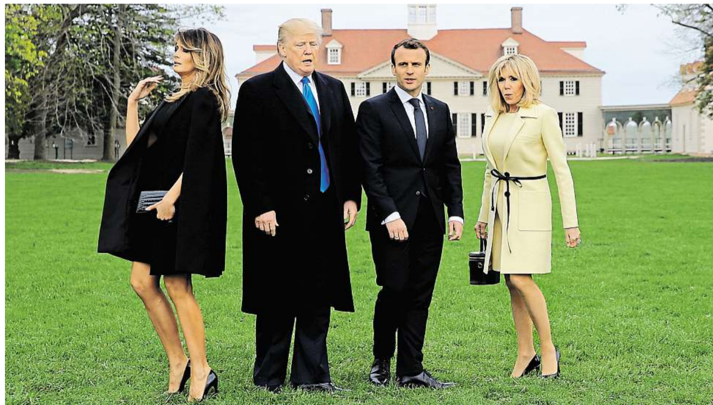
První muži, první dámy Donald Trump s manželkou Melanií přivítal v Americe Emmanuela Macrona s chotí Brigitte.

Francouzská spojka Macron chce být pro USA „pan Evropa“