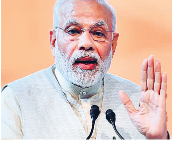
ఆంధ్రభూమి ప్రత్యేక ప్రతినిధి న్యూఢిల్లీ, మార్చి 12: కరోనా వైరస్ను అదుపు చేసేందుకు కేంద్ర ప్రభుత్వం ఆపస రద్దైన అన్ని చర్యలు తీసుకుంటోందని భరోసా ఇచ్చిన ప్రధాన మంత్రి నరేంద్ర మోదీ వైరస్ వ్యాపించకుండా చూసేందుకు ప్రయాణాలు, పర్యటనలు, పెద్ద పెద్ద సభలు, సమావేశాల దూరంగా ఉండాలని

దేశ ప్రజలకు హితవు చెప్పారు. దేశ ప్రజలందరి భద్రత కోసం కేంద్ర ప్రభుత్వం పాటు ఆయా రాష్ట్ర ప్రభుత్వాలూ పలు చర్యలు తీసుకుంటున్నాయని ప్రధాన మంత్రి తెలిపారు. వైద్య, ఆరోగ్య సేవలను మరింత పటిష్టం చేయటం, ఔషధాలను అందజాబులో పెట్టటంపాటు విదేశీయుల రాకను అరికట్టేందుకు వీసాల రద్దు వంటి పలు చర్యలు తీసుకుంటున్నామని నరేంద్ర మోదీ తెలిపారు. కేంద్ర మంత్రులు కొంత కాలం పాటు విదేశీ పర్యటనలకు వెళ్లరని ఆయన చెప్పారు. అవసరం లేని ప్రయాణాలు, పర్యటనలు చేయవద్దు. పెద్ద సంఖ్యలో గుమిగూడవద్దని ఆయన గురువారం పలు ట్వీట్లు ద్వారా ప్రజలకు సూచించారు. కరోనా వైరస్ మోదీ వైరస్ వ్యాపించకుండా చూసేందుకు భయాందోళనకు 'నో' చెప్పాలి, ముందు ప్రయాణాలు, పర్యటనలు, పెద్ద పెద్ద సభలు, సమావేశాల దూరంగా ఉండాలని