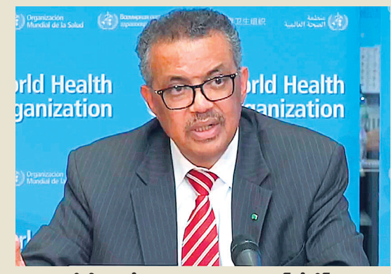
మీడియాలో మాట్లాడుతున్న డబ్ల్యూహెచ్ఐ చీఫ్ తెడ్రోస్ అధనోమ్ గెబ్రెయేసుస్