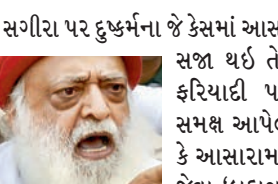
સગીરા પર દુષ્કર્મના જે કેસમાં આસારામને ભુષવારે જન્મટીપની સજા થઈ તે કેસની ટ્રાયલ દરમિયાન ફરિયાદી પક્ષના એક સાક્ષીએ કોર્ટ સમક્ષ આપેલી જુબાનીમાં જણાવ્યું હતું કે આસારામનું એવું માનવું હતું કે તેના જેવા 'બ્રહ્મજ્ઞાની'ને છોકરીઓનું જાતીય શોષણ કરવાથી કોઈ પાપ લાગતું નથી. આસારામના અનુયાયી રહેલા રાહુલ સાયર

કેદી નં. 130 એટલે કે આસારામે ઉપવાસ કર્યો