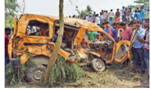
2016માં ભદોઈમાં 8 બાળકોનાં આવી રીતે મોત થયાં હતાં

ઉત્તરપ્રદેશના કુશીનગરમાં માનવરહિત રેલવે કોસિંગ પર સ્કૂલ વાન પેસેન્જર ટ્રેન સાથે અથડાતાં 7 ભાઈ-બહેન સહિત 13 વિદ્યાર્થીઓનાં મોત થયાં હતાં. તમામ બાળકો 7થી 11 વર્ષના હતાં. અન્ય 8 બાળકોને ઈજા પણ થઈ છે. ઘટના વખતે વાનમાં 25 બાળકો હતાં.