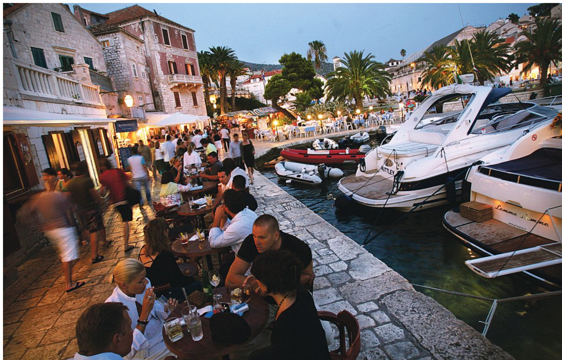
Središče mesta Hvar in številna druga mesta ob jadranski obali se poleti spremenijo v prave človeške čebelnjake, iz katerih hotelirji in gostinci namesto medu pobirajo denar.

Podražitve Seriji rekordnih turističnih sezon na Hrvaškem ni videti konca, velikemu povpraševanju sledijo visoke cene